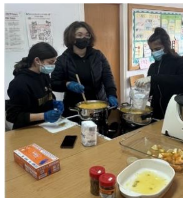
Μαθητές Γυμνασίου δημιουργούν διάφορα προϊόντα από τα εσπεριδοειδή που πέφτουν από τα δέντρα της περιοχής

Το ευρύτερο όραμά μας προσδιορίζεται από την έννοια του Ανοικτού Σχολείου: ενός σχολείου ανοικτού προς την κοινωνία, το οποίο εξελίσσεται σε παράγοντα ευημερίας της κοινότητας, αναπτύσσοντας συνεργασίες με πρόσωπα και φορείς στο τοπικό του περιβάλλον.