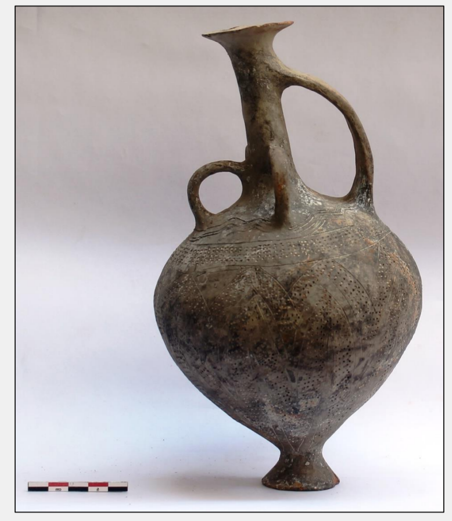
Εικ. 4: Κεραμική πρόχους από την Τίμη, περ. 1700-1650 π.Χ. (Ανασκαφές Τμήματος Αρχαιοτήτων)