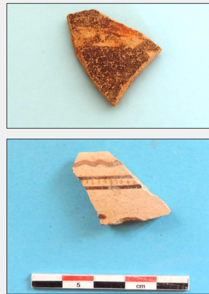
Εικ. 2-3: Θραύσματα κεραμικής από την Παλαίπαφο, περ. 1700-1650 π.Χ.

Οι κεραμολογικές μελέτες που διενεργήθηκαν στο πλαίσιο του ARIEL επιβεβαίωσαν ότι η πρώτη εγκατάσταση στο χώρο της Παλαίπαφου ανάγεται στη μεταβατική φάση του τέλους της Μέσης και των αρχών της Ύστερης Κυπριακής Χαλκοκρατίας (περ. 1700-1600 π.Χ.) (Εικ. 2-3). Επιπλέον, μέσα από τη μελέτη των υλικών καταλοίπων από αρχαιολογικές θέσεις στην περιοχή της Πάφου (Εικ. 4) παρατηρήθηκε ότι την ίδια περίοδο οι πλείστες από αυτές εγκαταλείπονται. Αυτό φανερώνει ότι η πρωιμότερη εγκατάσταση στην Παλαίπαφο οφείλεται στη συνάντηση πληθυσμών από διάφορες κοινότητες που συσπειρώθηκαν στην ακτή. Είναι πιθανόν αυτή η αλλαγή στο οικιστικό πλαίσιο να σχετίζεται με το σύνθετο οικονομικό σύστημα που καθιερώνεται με την έναρξη της Ύστερης Χαλκοκρατίας στο νησί και το οποίο έχει ως επίκεντρο την επεξεργασία του χαλκού και την εξαγωγή του από θέσεις-λιμάνια.