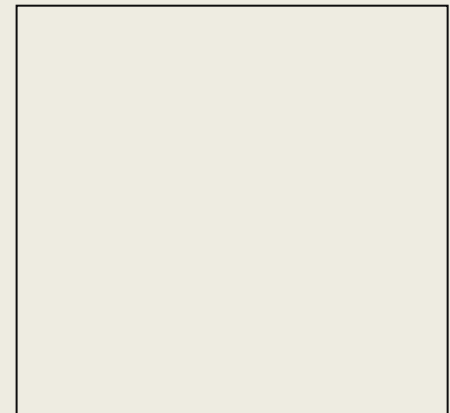
Εικόνα 2: Γεωλογικός χάρτης της περιοχής Παλαιάφου στον οποίο παρουσιάζονται οι κυριότερες αρχαιολογικές θέσεις της Ύστερης Εποχής του Χαλκού σε σχέση με το ιερό της θεάς.