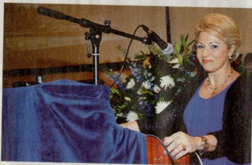
Η νυν πρόεδρος της Ελληνικής Αρχαιολογικής Επιτροπής της Μεγάλης Βρετανίας Ζέττα Θεοδωροπούλου - Πολυχρονιαδά. Δίπλα, τμήμα του χώρου ανασκαφής από ψηλά.

περιοχή όπου ιδρύθηκε και αναπτύχθηκε η Πάφος, μία από τις σθεναρότερες πόλεις-βασίλεια της αρχαίας Κύπρου. Καθηγήτρια Προϊστορικής και Πρωτοϊστορικής Αρχαιολογίας, η ομιλήτρια είναι διδάκτωρ του Τμήματος Κλασικών Σπουδών του Πανεπιστημίου Cincinnati και διετέλεσε μεταδιδασκαρική ερευνήτρια και εταίρος του Ινστιτούτου Κλασικών Σπουδών του Πανεπιστημιακού Κολεγίου του Λονδίνου. Πριν από την εκλογή της στο Πανεπιστήμιο Κύπρου