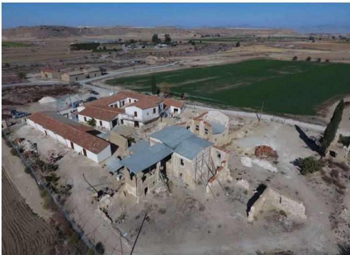
Πανοραμική άποψη Συγκροτήματος

Υπογράφηκε σήμερα η συμφωνία μεταξύ της Κυπριακής Κυβέρνησης και του Πανεπιστημίου Κύπρου για παραχώρηση της Αγρέπαυλης της Ποταμιάς στο Τμήμα Βιολογικών Επιστημών για αξιοποίηση και χρήση του μνημείου, για περίοδο 10 χρόνων