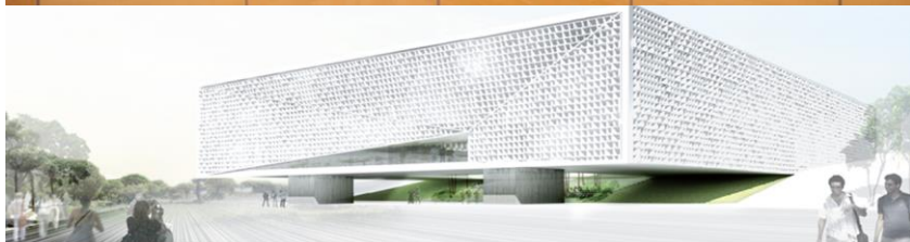
ΚΤΗΡΙΟ ΙΑΤΡΙΚΗΣ ΣΧΟΛΗΣ ΚΑΙ ΕΠΙΣΤΗΜΩΝ ΥΓΕΙΑΣ ΝΙΚΟΣ Κ. ΣΙΑΚΟΛΑΣ