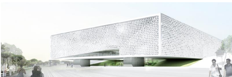
ΚΤΗΡΙΟ ΙΑΤΡΙΚΗΣ ΣΧΟΛΗΣ ΚΑΙ ΕΠΙΣΤΗΜΩΝ ΥΓΕΙΑΣ ΝΙΚΟΣ Κ. ΣΙΑΚΟΛΑΣ

Υπογράφηκαν τα συμβόλαια για τον αρχιτεκτονικό σχεδιασμό των κτηριακών εγκαταστάσεων της Ιατρικής Σχολής και Επιστημών Υγείας «Νίκος Κ. Σιακόλας» του Πανεπιστημίου Κύπρου