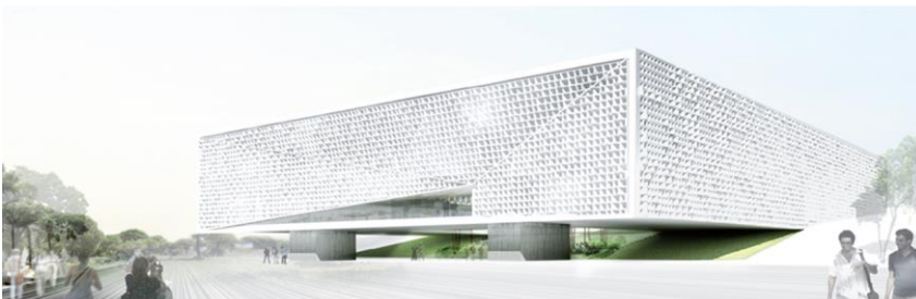
ΚΤΗΡΙΟ ΙΑΤΡΙΚΗΣ ΣΧΟΛΗΣ ΚΑΙ ΕΠΙΣΤΗΜΩΝ ΥΓΕΙΑΣ ΝΙΚΟΣ Κ. ΣΙΑΚΟΛΑΣ