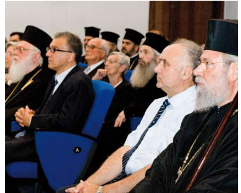
Από δεξιά: Ο Μακαριότατος Αρχιεπίσκοπος Κύπρου κ.κ. Χρυσόστομος Β', ο Πρόεδρος του Συμβουλίου του Πανεπιστημίου κ. Χάρης Χαραλάμπους, ο Αντιπρύτανης Ακαδημαϊκών Υποθέσεων Καθηγητής Κωνσταντίνος Χριστοφίδης και ο Μακαριότατος Αρχιεπίσκοπος Τιράνων.

Στη συνέχεια ακολουθεί μια σύντομη ταινία, η οποία παρουσιάζει στιγμές από την ιεραποστολική πορεία του Αρχιεπισκόπου Αναστασίου.