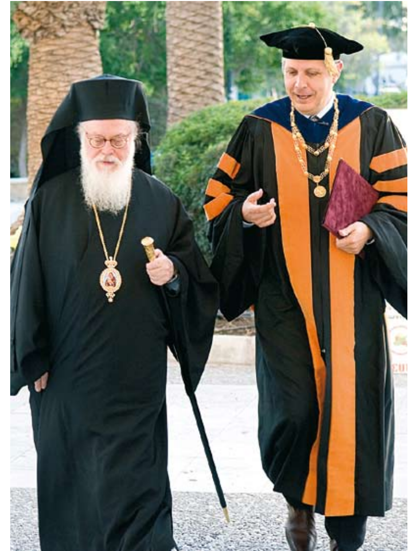
Ο Μακαριότατος Αρχιεπίσκοπος Τιράνων, Δυρραχίου και πάσης Αλβανίας κ.κ. Αναστάσιος με τον Πρύτανη του Πανεπιστημίου Κύπρου Καθηγητή Σταύρο Α. Ζένιο.

Οι ομιλητές, διακεκριμένες προσωπικότητες, θα προσκαλούνται στην έδρα του Πανεπιστημίου Κύπρου και τα κείμενα των διαλέξεών τους θα εκδίδονται σε ειδικό τεύχος. Έτσι, το Πανεπιστήμιο θα διατηρήσει ζωντανή και θα τιμά τη μνήμη ενός ευπατρίδη της Ευρώπης που συνέτεινε όσο λίγοι στην πρόοδο του ανώτατου πνευματικού ιδρύματος της ιδιαίτερης πατρίδας του.