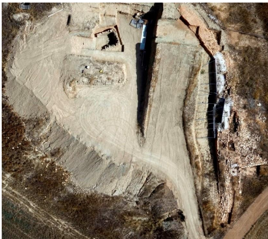
Εικ.6. Λαόνα - ΒΑ τέταρτο τύμβου με το τείχος του φρουρίου στα ανατολικά

Ανάμεσα στη βόρεια και τη μνημειακή ανατολική όψη του τείχους (Εικ.6). - που είναι προσωρινά αθέατη, αφού έχει επικαλυφθεί για σκοπούς προστασίας από το Τμήμα Αρχαιοτήτων - αποκαλύφθηκε τμήμα μήκους 3 μέτρων, το οποίο αντί για πιλόπλινθους έχει στην όψη αργούς λίθους