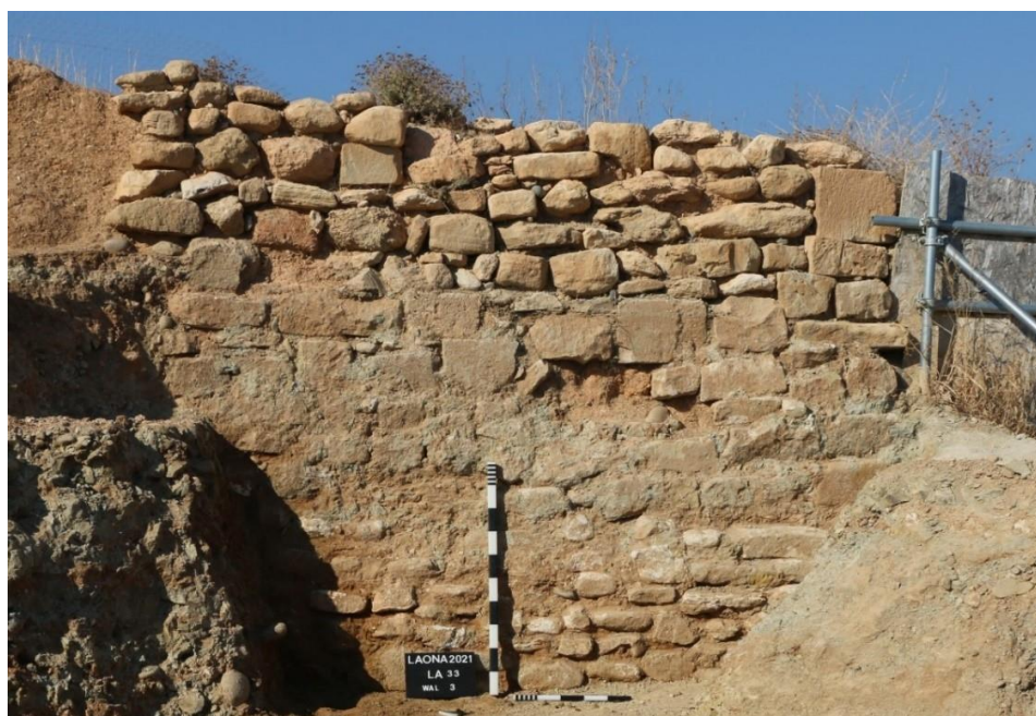
Εικ. 7. Λαόνα – η λίθινη όψη του τείχους

Ανάμεσα στη βόρεια και τη μνημειακή ανατολική όψη του τείχους (Εικ.6). - που είναι προσωρινά αθέατη, αφού έχει επικαλυφθεί για σκοπούς προστασίας από το Τμήμα Αρχαιοτήτων - αποκαλύφθηκε τμήμα μήκους 3 μέτρων, το οποίο αντί για πιλόπλινθους έχει στην όψη αργούς λίθους