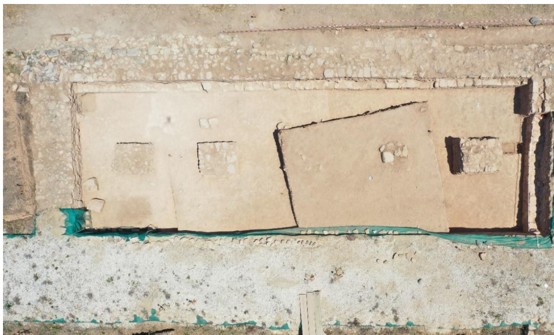
Εικ.3. Μονάδα 10 με πεσσούς

Συγχρόνως, η συνέχιση της ανασκαφής στο δυτικό τμήμα των εργαστηρίων αποκάλυψε τη Μονάδα 10, η οποία είναι αποτέλεσμα ενός εντελώς νέου αρχιτεκτονικού σχεδιασμού: πρόκειται για μια ενιαία αίθουσα μεγάλων διαστάσεων (16.20μ. μήκος και 5.30μ. πλάτος) με εμβαδόν 85.8 τ.μ. (Εικ.3) .