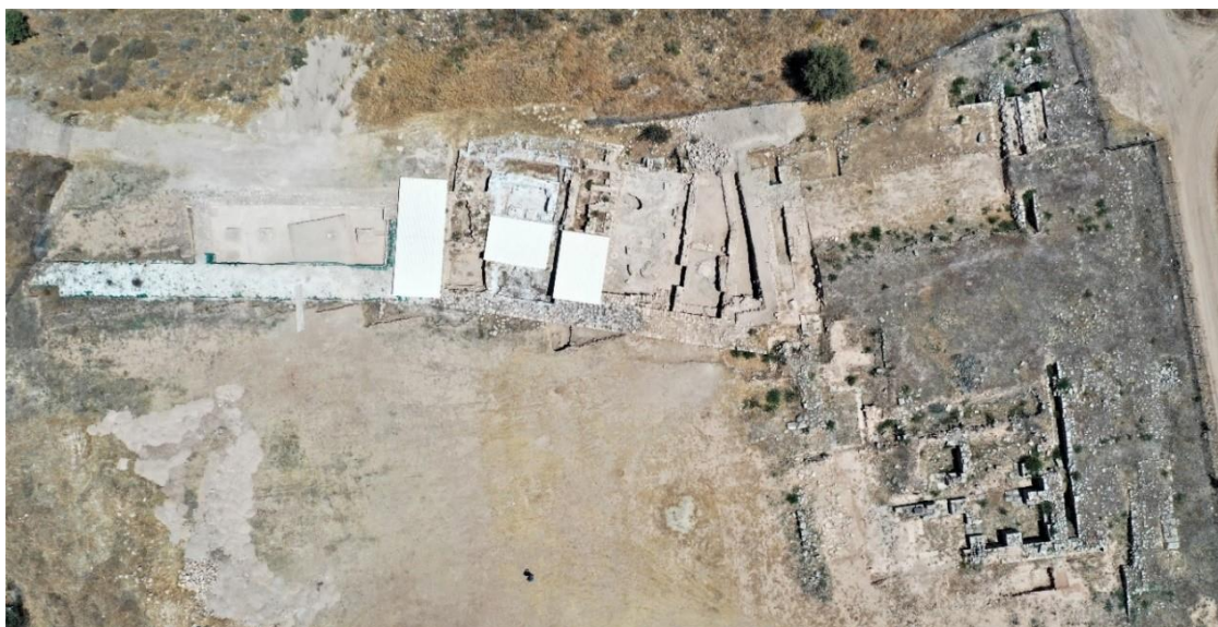
ΕΙΚ. 2: Χατζηαππουλλάς 2021: Ανακτορικό σύμπλεγμα (ανατολικά) και Εργαστηριακό Σύμπλεγμα (δυτικά) με προσωρινές οροφές προστασίας.