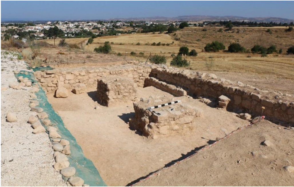
Εικ.4. Μονάδα 10 - Διακρίνονται οι δυο πεσσοί του δυτικού τμήματος