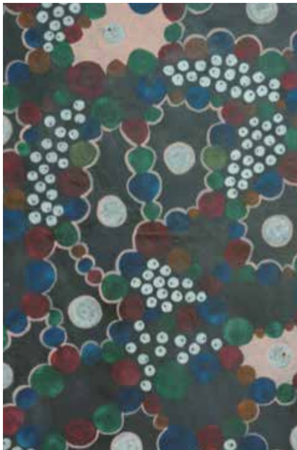
Ο πίνακας με τίτλο «Cell Culture», ο οποίος διακρίθηκε στο διεθνή διαγωνισμό του Society for Laboratory Automation and Screening στις ΗΠΑ, με θέμα «Η Τέχνη της Επιστήμης». Διαστάσεις/Υλικά: πίνακα: 61 x 76 cm, Υλικά: ακρυλική μπογιά και κιμωλία σε καμβά.

Για περισσότερες πληροφορίες μπορείτε να τηλεφωνήσετε στον αριθμό: 99-207909 ή να επισκεφτείτε την ιστοσελίδα: http://www.wix.com/zeinalip/zeinalipart