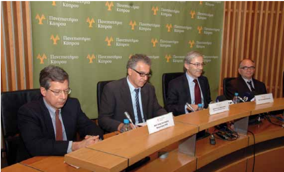
Στιγμιότυπο από τη δημοσιογραφική διάσκεψη που παραχώρησε ο Καθηγητής Χριστόφορος Πισσαρίδης μετά την ανάληψη των καθηκόντων του στο Πανεπιστήμιο Κύπρου

ΚΟΡΥΦΑΙΑ ΙΣΤΟΡΙΚΗ ΣΤΙΓΜΗ ΓΙΑ ΤΟ ΠΑΝΕΠΙΣΤΗΜΙΟ ΚΥΠΡΟΥ